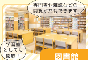
学習室 としても 開放!