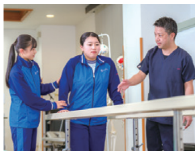
静岡理学療法学科

連携講座Ⅰ・Ⅱ・Ⅲで看護学科、静岡理学療法学科、法学部の先生方に直接ご指導を受けています。隣接しているため気軽に先生方や学生に質問をすることができます。 高校に在籍しながら大学の授業を一足先に体験することができます。 本校は看護学科への進学者数県下 No.1 !